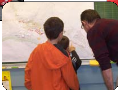
◀ Activité sur les plans d'un village

Les Classes Urbaines bénéficient du soutien de :