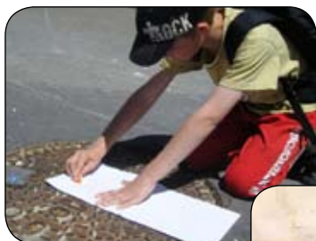
▲ «Bouche d'égoût» pour découvrir les réseaux souterrains

Candice Chaillou au 03 80 45 92 23 - c.chaillou@pirouette-cacahuete.net