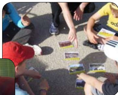
▲ «DéTECTIVES MOBILES» sur les transformations de la ville en lien avec nos moyens de transports