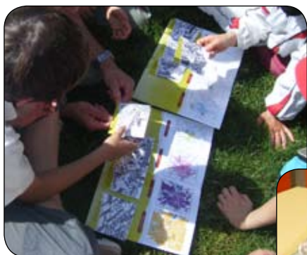
▲ «Villes Ogresses» pour comprendre l'étalement urbain de Dijon en lien avec son histoire.

Avec un animateur-environnement, votre classe découvrira «in situ» comment Dijon s'est façonnée au fur et à mesure de son histoire, des Hommes et des techniques, et comment elle évolue en fonction des enjeux environnementaux d'aujourd'hui et de demain. 6 activités de nos Sacs à Sentiers® leur permettront d'aborder toutes les thématiques des Classes Urbaines.