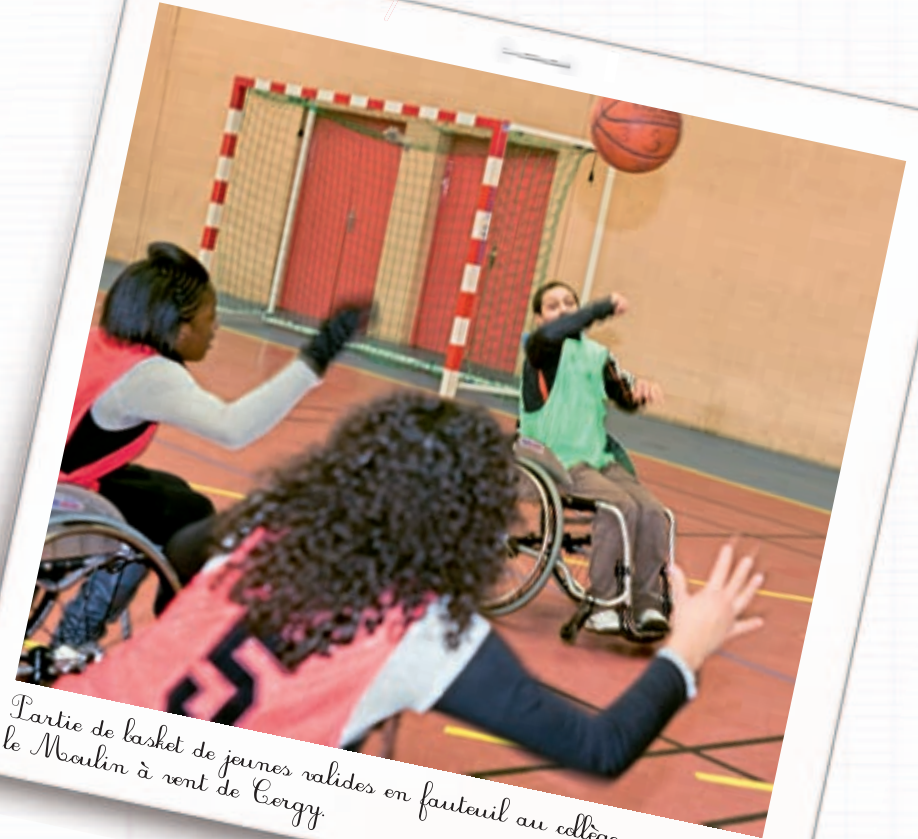
Partie de basket de jeunes valides en fauteuil au collège le Maulin à Font de Cergy.