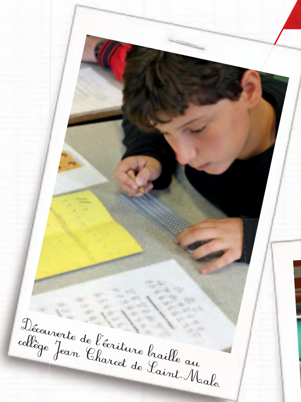
Découverte de l'écriture braille au collège Jean Charest de Saint-Malo.

“ POUR LE DROIT À LA DIFFÉRENCE CONTRE L'INDIFFÉRENCE! ”