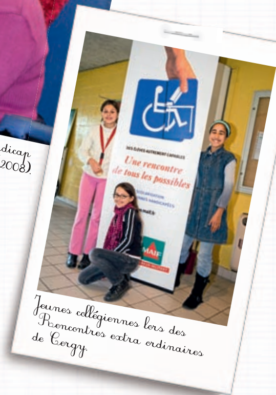
Jeunes collégiennes lors des Rencontres extraordinaires de Cergy.