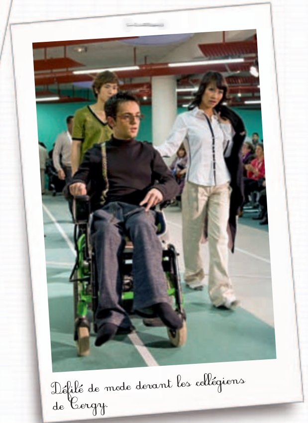
Défilé de mode devant les collégiens de Cergy.