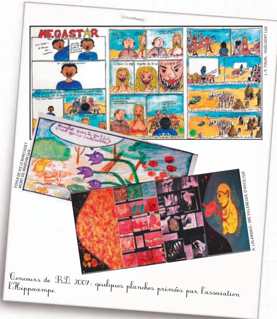
Concours de BD 2007: quelques planches primées par l'association l'Hippocampe.