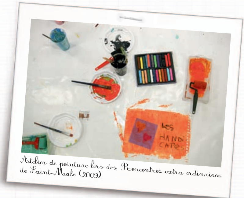
Atelier de peinture lors des Rencontres extra ordinaires de Saint-Malo (2009).

La découverte et la prise de conscience progressive des handicaps intellectuels et moteurs de son enfant sont les expériences les plus douloureuses qui soient.