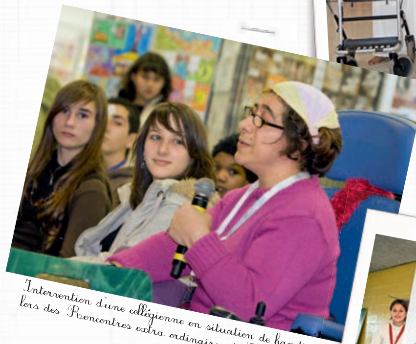
Intervention d'une collégienne en situation de handicap lors des Rencontres extraordinaires de Cergy. (2008).