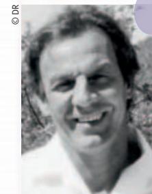
Charles Gardou 2009 Professeur à l'université Lumière Lyon 2

Dans un collège de centre-ville regroupant des enfants provenant de milieux souvent favorisés, la présence d'élèves handicapés est une véritable chance et un devoir. Dans mon établissement, cette intégration dans toutes les classes de 25 élèves déficients cognitifs, aveugles, malvoyants, sourds et dysphasiques ne pose pas problème. C'est une leçon d'humilité.