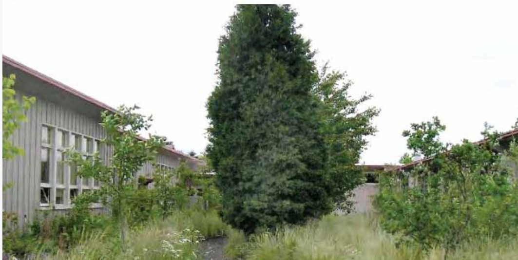
À Portland, la désimpermeabilisation d'une cour d'école