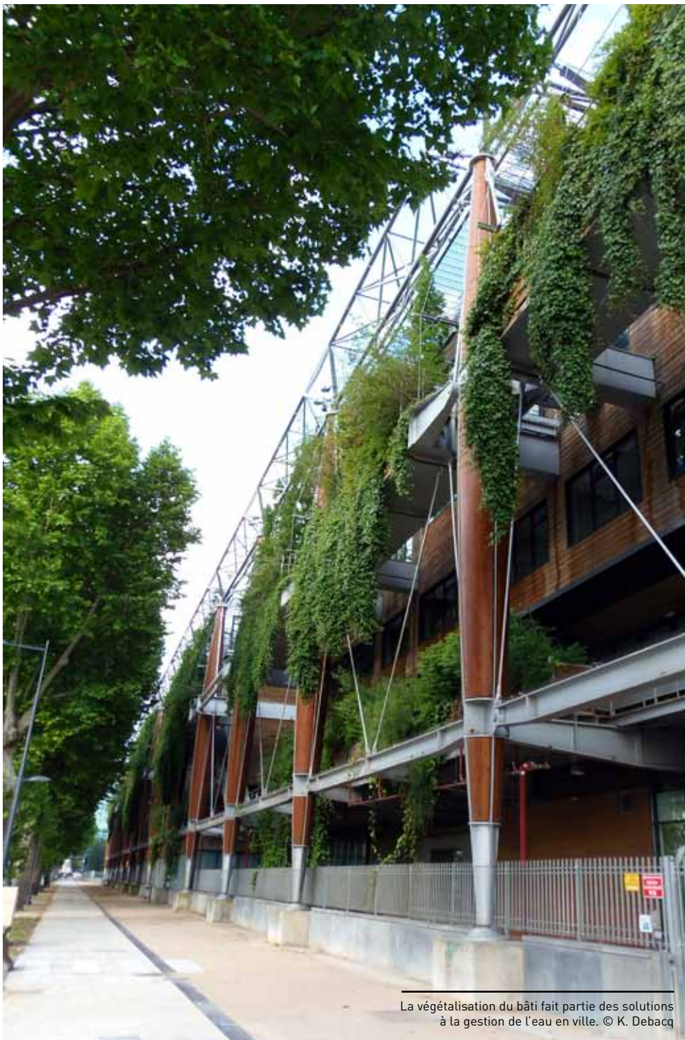
La végétalisation du bâti fait partie des solutions à la gestion de l'eau en ville.

Enfin, prenons exemple sur de nombreuses communes (comme celles de Strasbourg, Rennes, Montreuil, etc.) qui ont engagé des opérations de déminéralisation des espaces urbains (cours d'école, anciens parkings, bords de routes, dalles obsolètes...). Il existe en Île-de-France un potentiel considérable de zones pouvant être redonnées à la nature.