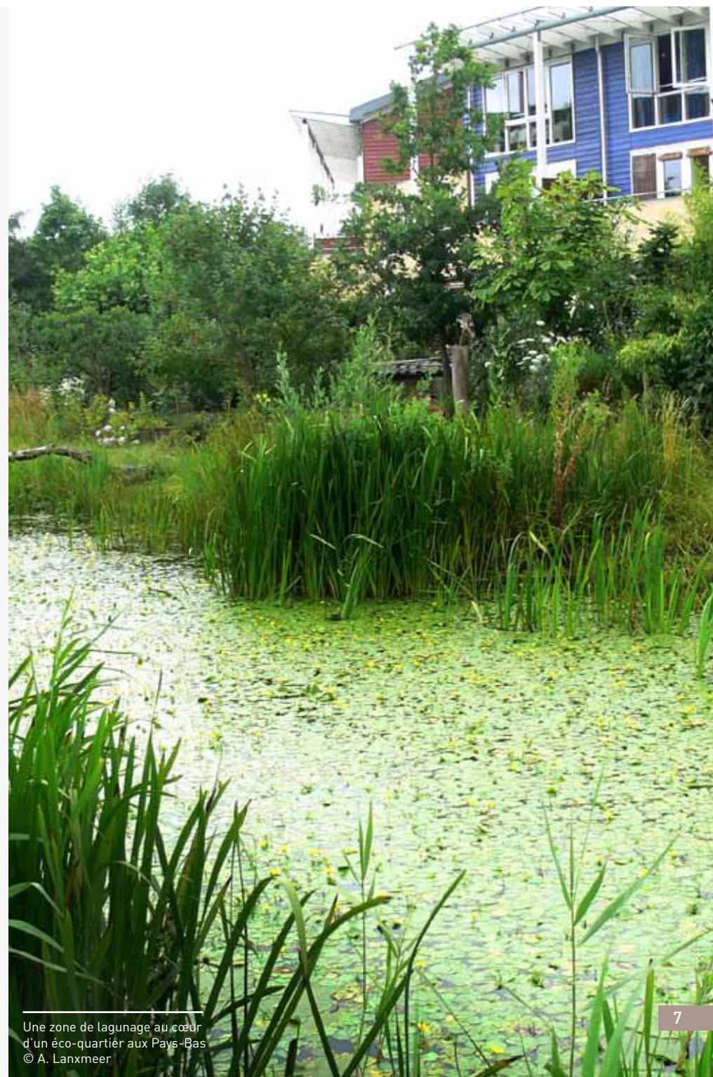
Une zone de lagunage au cœur d'un éco-quartier aux Pays-Bas