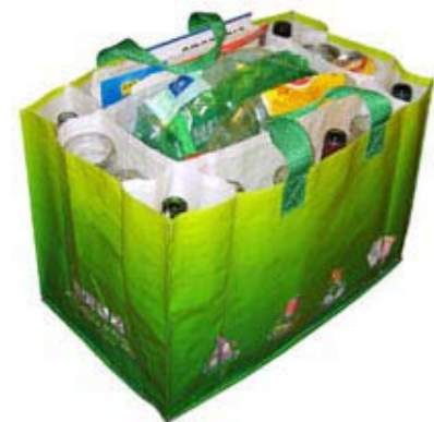
Des sacs de tri sont désormais disponibles lors des séjours

La base de Baye a accueilli en septembre le tournage d'un documentaire de 52 minutes basé sur des témoignages et des expériences de terrain : HANDIVOILE . Le but est de sortir un DVD ayant pour vocation de montrer que la voile est un sport accessible à la majorité des personnes porteuses d'un handicap, qu'il soit physique ou mental. Le documentaire est coproduit par France 3 Bourgogne-Franche-Comté et 7e apache film . C'est un outil de sensibilisation auprès des enseignants, des éducateurs spécialisés et des personnes en situation de handicap. Des films pour la formation destinés à faciliter la mise en œuvre de la pratique handivoile, outil de formation à destination des encadrants voile, des enseignants et des étudiants compléteront le support.