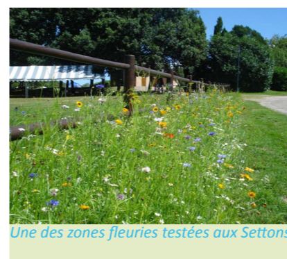
Une des zones fleuries testées aux Settons

Tout pour la biodiversité - Semis de zones fleuries sur l'«Éco-Base» des Settons dans le souci de favoriser les populations d'insectes mais aussi dans un souci d'esthétisme. Réalisation de bandes enherbées afin de garder un caractère sauvage favorisant l'établissement de la faune et laissant la flore locale s'exprimer. «La beauté d'un site et l'aménagement adapté favorise le respect de ses visiteurs» ;