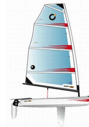
Un nouveau support : l'OpenBic