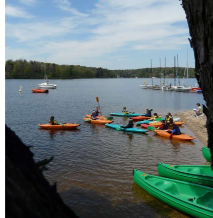
Des élèves du collège de Montsauche-Les-Settons en option Sports de Pleine Nature