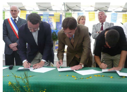
Signature partenariale de la Charte du Sun Festival.